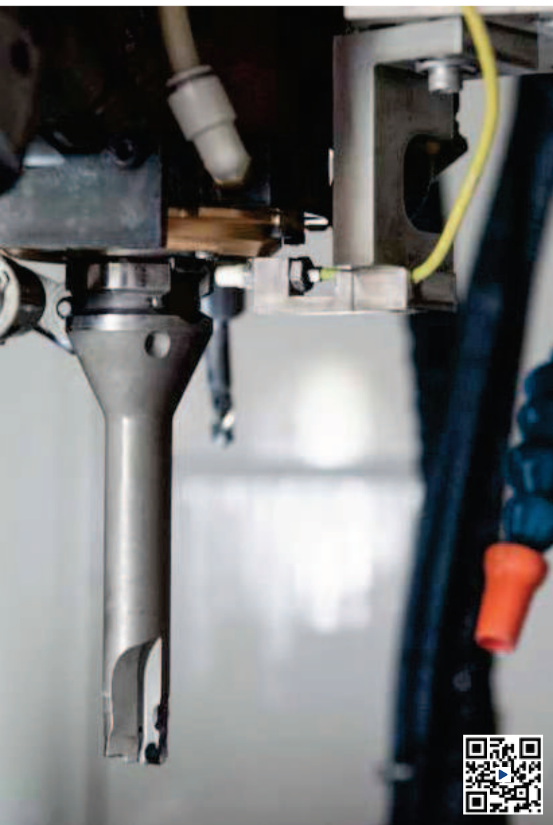
Sensor des ATC Rundlauf-Erkennungssystems: Bei einer Spindeldrehzahl von 600 \text{ min}^{-1} dauern die Messungen gerade einmal 0,3 s.

Vorteil: Ausschuss wird vermieden und maßliche Vorgaben für die Bohrungen werden eingehalten.